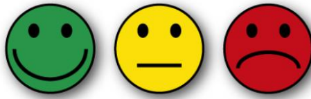
Bild 3. Utvärdering

Utvärdering av inträffade händelser innebär att systematiskt och transparent göra värderingar av involverade aktörers hantering av händelsen. Att en utvärdering är systematisk och transparent innebär att den genomförs på ett strukturerat sätt och att utvärderingsfrågor, bedömningskriterier, målgrupp, datainsamlingsmetod och slutsatser redovisas i en utvärderingsrapport.